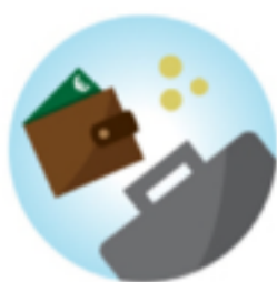
werk & inkomen