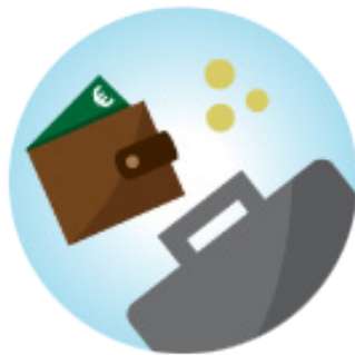
Werk en inkomen