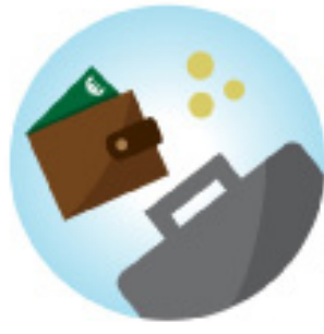
Werk en inkomen